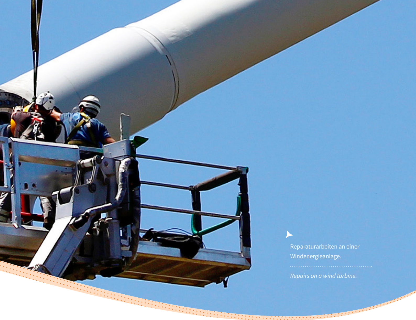
▶ Reparaturen an einer Windenergieanlage. ..... Repairs on a wind turbine.